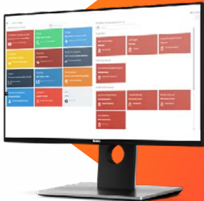
d.3one - Dokumentenmanagement mit dem Webbrowser auf HTML-Basis.

Mit Hilfe von d.3ecm usern können alle Mitarbeiter in Ihrem Unternehmen nach ihrem individuellen Nutzungsgrad in das d.3ecm-System eingebunden werden.